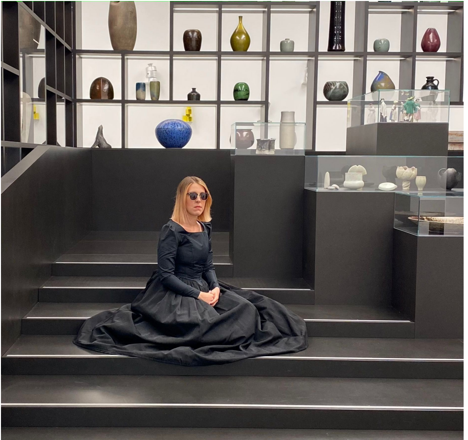
ARIEL EFRAIM ASHBEL | Phänomenologie des Verschwindens (2020)