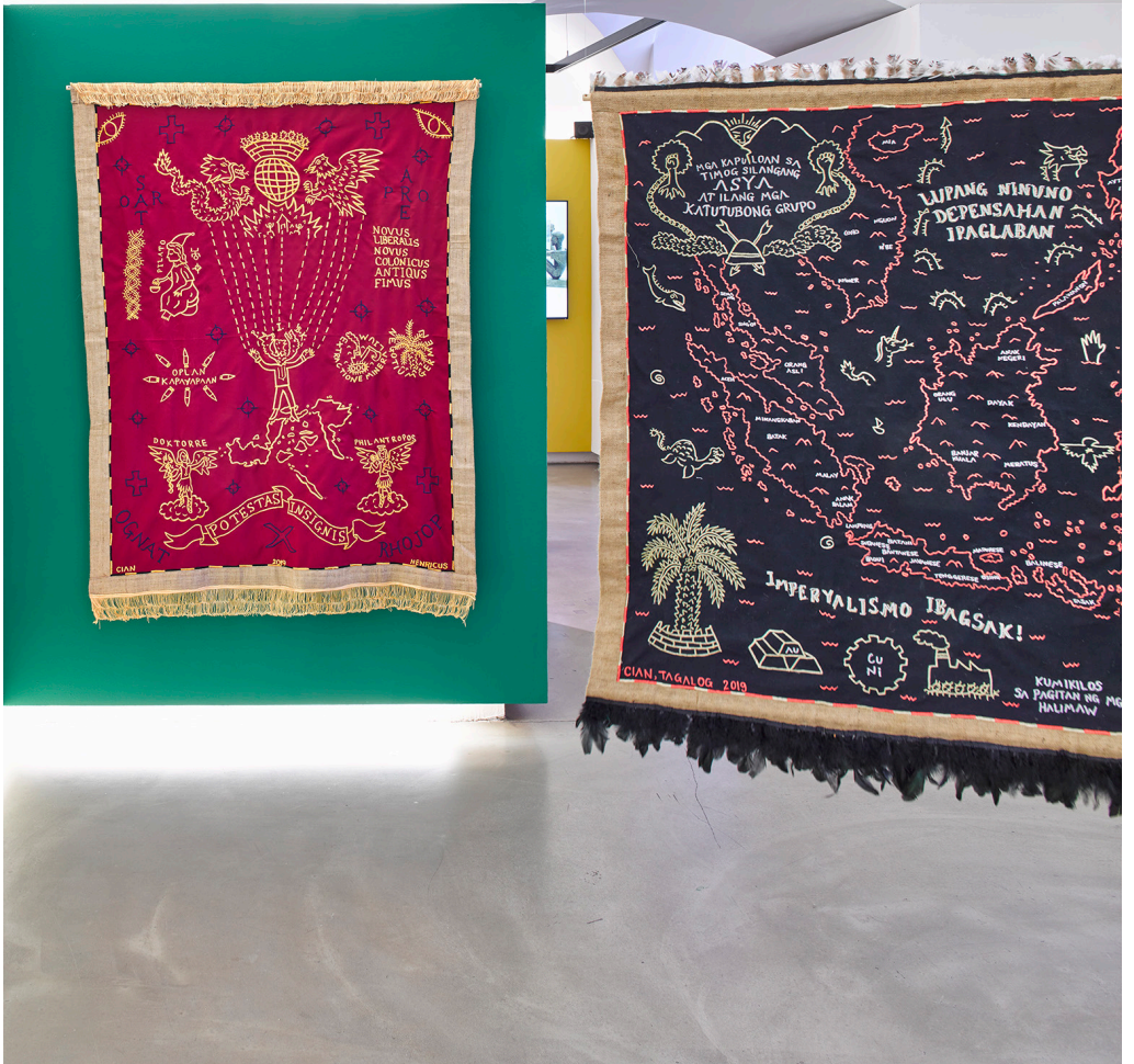
links: CIAN DAYRIT | Adversus Contradictores II (2019) rechts: CIAN DAYRIT | We Move Amongst Monsters (2019)